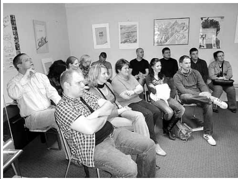
Unsere Bauherren beim Fachforum Luft/Wasser-Wärmepumpen im Einsatz