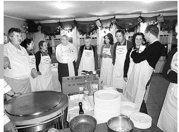
Unsere Bauherren beim Kochen